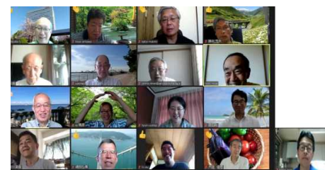
2020年はコロナ対応のため、リモートで開催 毎回約30～40名が参加