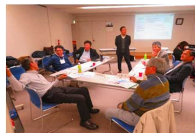
活動の会場 ユニオンビル5F多目的ホール 富士通社友会事務局同フロア