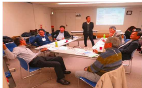
活動の会場 ユニオンビル5F多目的ホール 富士通社友会事務局同フロア